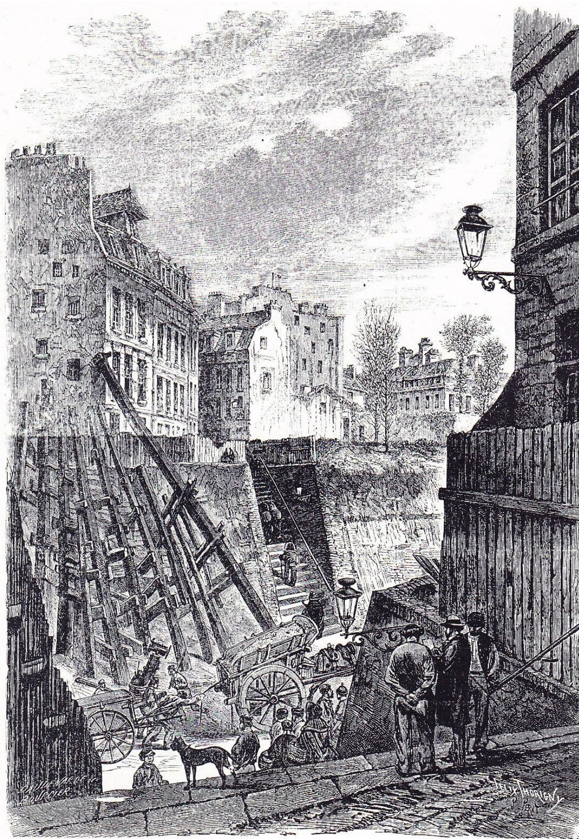
DÉMOLITIONS POUR LE PERCEMENT DE LA RUE DE RENNES.

D'après une gravure du temps.